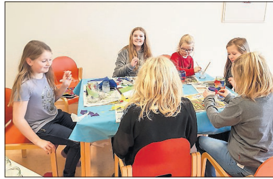
POPULÆRT: Flere barn var inn om lanterneverkstedet.

I fjor var rundt 300 personer innom den populære julemessa, der lokale produsenter selger julegaver.